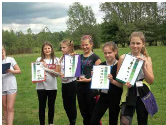
Žáci si pobyt v CEA Sluňákov pořádně užili

Děkujeme všem pedagogickým pracovníkům, kteří se podíleli na přípravě i realizaci jednotlivých vystoupení, za jejich trpělivost, obětavost a čas strávený s dětmi. Naším divákům děkujeme