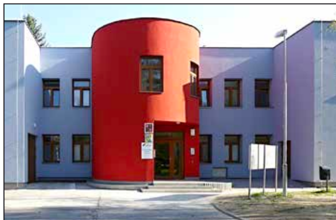
Nová budova DDM Magnet Mohelnice