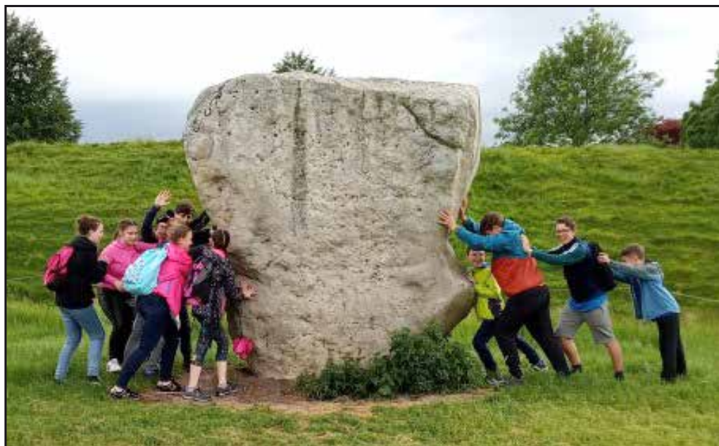
Zájezd do Anglie byl nabitý zajímavostmi