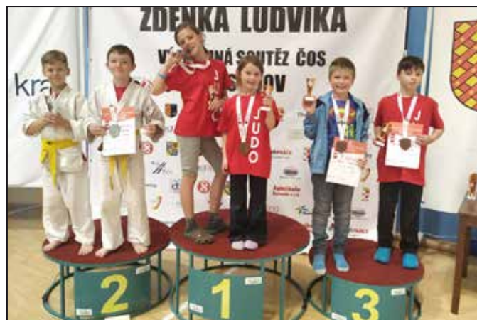
Mohelničtím judistům se v Prostějově dařilo