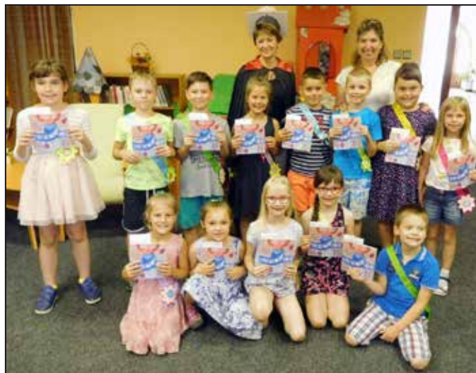
Malí čtenáři z 1. A ZŠ Vodní