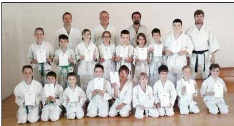
Všichni účastníci zkoušek