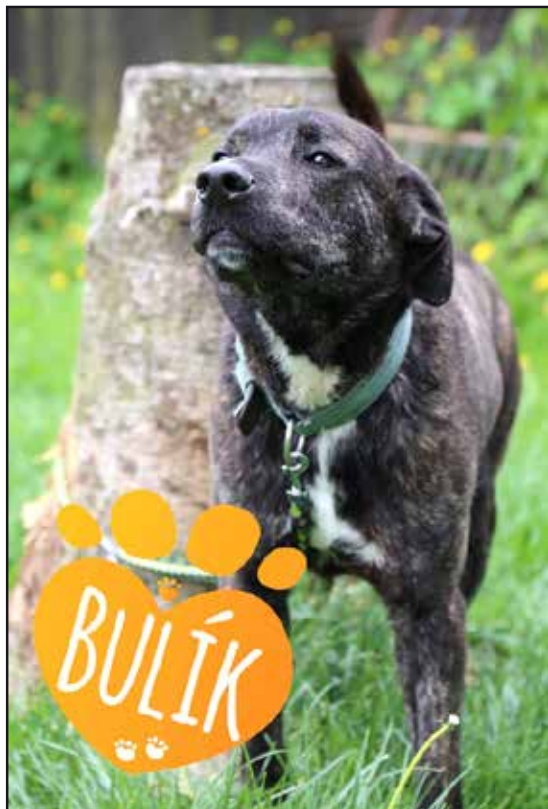
Po amputaci zadní končetiny se Bulíkovi ulevilo