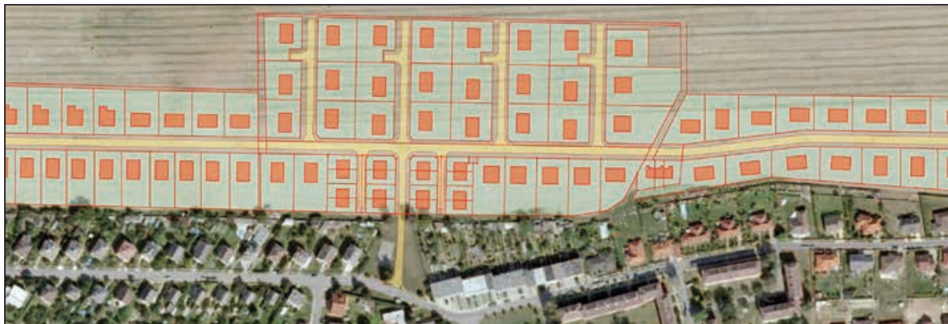
Nová výstavba rodinných domků v lokalitě Mohelnice-sever