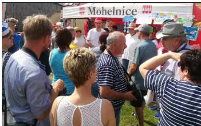
Před stánkem města Mohelnice bylo rušno