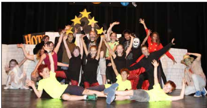
Děti předvedly rodičům, co se naučily