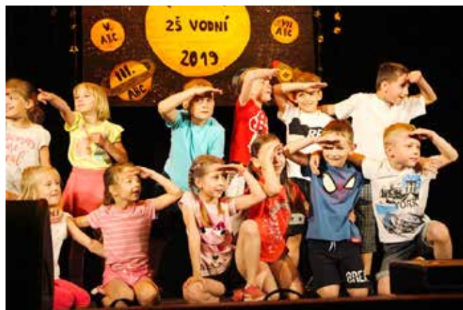
Jedno z vystoupení na Akademii 2019