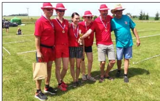
Vítězný tým zástupců města Mohelnice s pořádajícím starostou Úsova