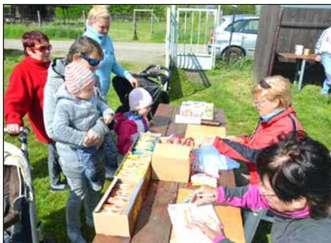
Mohelnický vandr se těší velké účasti.