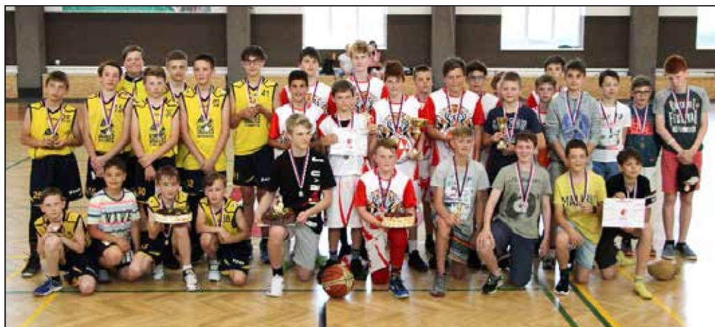
Moheminiba 2019 – kluci