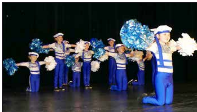
Malé roztleskávačky s vystoupením Námořníci