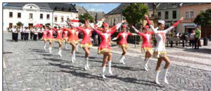
Mažoretky ZUŠ Mohelnice přivedly průvod na náměstí