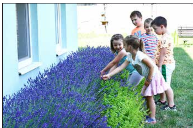
Takto vypadá levandulový lán na zahrádce MŠ Hálkova