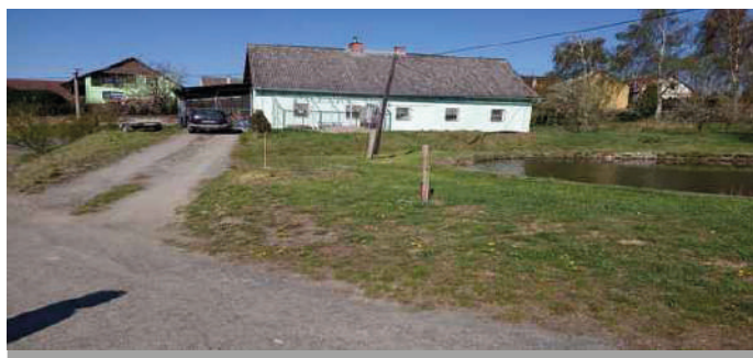
K venkovskému rybníku patří vrba, dále rybník olemují nové lípy.

V letošním roce budou muset být při výsadbě respektována a dodržována mimořádná vládní nařízení týkající se současné epidemiologické situace, aby byla zajištěna bezpečnost účastníků. Pokračovat v sázení se bude dále v roce 2021 v Mohelnici, kde bude vysazeno 40 ks stromů včetně keřů, trvalek a cibulovin, v obci Libivá bude vysazeno 29 ks stromů včetně keřů, trvalek a cibulovin, v obci Květín 17 ks stromů včetně keřů a v obci Křemačov 24 ks stromů včetně keřů.