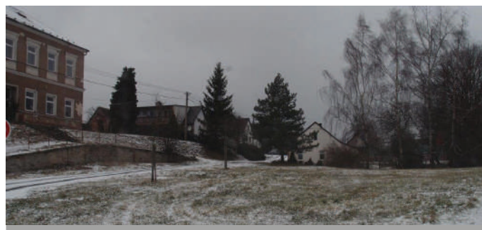
Prázdné prostranství pod školou ožíví mimo jiné i sakura s růžovými květy.