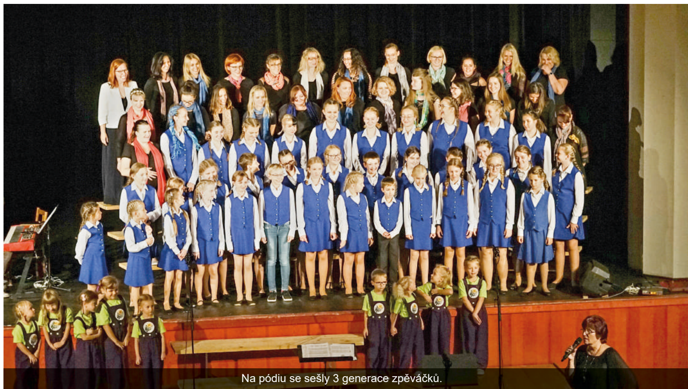
Na pódiu se sešly 3 generace zpěváček.