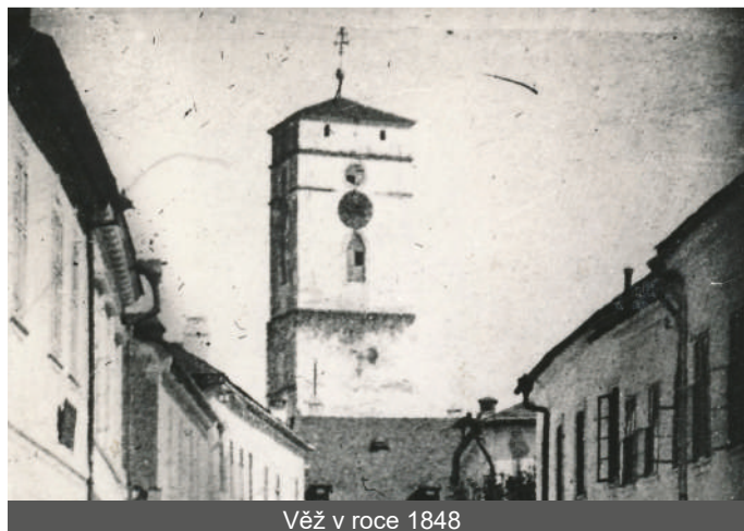
Věž v roce 1848