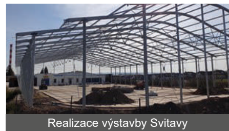
Realizace výstavby Svitavy

Už několik let osobně registruji velice živou debatu nad možností vybudování zimního hokejového stadionu nebo umělé ledové plochy a musím přiznat, že mi je tato myšlenka velice blízká. Chápu, že v místních podmínkách by vybudování tohoto sportoviště pouze z rozpočtu města bylo velice obtížné. Možné jsou tedy dvě varianty. První variantou je možnost vybudování multifunkční hokejové haly, která by v zimě sloužila pro potřeby bruslení a v další části roku jako multifunkční areál pro pořádání různých sportovních a kulturních akcí. Předpokládaná pořizovací cena je cca 70 mil. s možností 70 % dotace do maximální výše 50 mil. Kč. Odhad provozních nákladů, bez započítání příjmu za pronájem ledové plochy, je cca 3 mil./rok. Druhá varianta otevřené ledové plochy je závislá na požadované velikosti kluziště, kdy předpokládaná cena je cca 6.500 za 1m 2 . Celkový předpoklad u této varianty a velikosti kluziště 26 x 58 m je cca 11 mil., ale bez možnosti čerpání dotačních prostředků, protože ty jsou vázány pouze k výstavbě zastřešených hal. Obě varianty pak předpokládají nutnost vybudování zázemí a zajištění obsluhy a údržby. A jak zaznělo na zastupitelstvu města od jednoho z občanů, abychom mohli město rozvíjet a využít dotačních prostředků, musíme být projektově připraveni. To platí nejen v případě multifunkční haly. Získání dotačních prostředků je tedy základním předpokladem realizace.