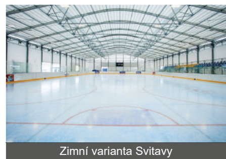
Zimní varianta Svitavy

Ladovské zimy už v našich končinách nejsou a možnost bruslení se přesunula pouze na umělé ledové plochy a do hal. Sami si vzpomeňte, kdy jste byli naposledy bruslit na rybníku. Brusle a hokejka byla skoro povinná výbava každého dítěte. Pamatuji si dobu, kdy mi rodiče doma utáhli „křížky“ a já jsem v bruslích došel přímo až na led. A co těch pláček a hřišť v Mohelnici bylo. Ze všech stran slyšíme, že děti nesportují, že jsou obézní, že jen sedí doma u počítače nebo mobilu. Budováním nových sportovišť dáváme jasný signál, že nám na pohybových dovednostech dětí záleží. Říkáme, že naší prioritou je mít zdravé a silné děti, které si vybudují celoživotní vztah ke sportu. Sportovním zápolením si děti utváří vzájemné vztahy, rozvíjí soutěživost, obratnost a logické myšlení a učí se řešit vzniklé situace. Proto říkám, že Mohelnice takové sportoviště potřebuje, protože za pár let se může stát, že brusle a bruslení bude pouze okrajová záležitost pro malou skupinu dětí. Je to tedy krok směrem do budoucnosti a v případě realizace předpokládáme masové využití široké veřejnosti, základních škol v rámci výuky tělesné výchovy z širokého okolí a v první fázi i pořádání amatérských hokejových soutěží. V mém okolí je spousta hokejových nadšenců, a proto věřím, že i vznik hokejového oddílu by byl jen otázkou času.