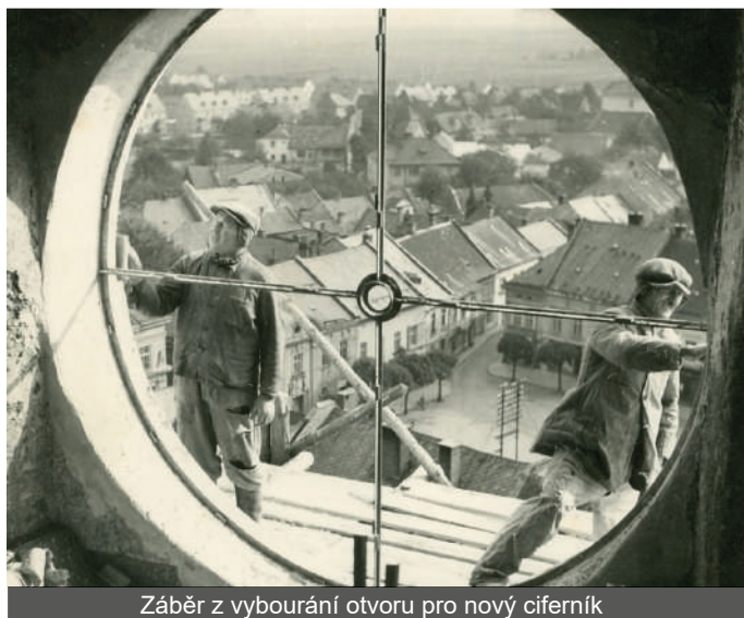
Záběr z vybourání otvoru pro nový ciferník