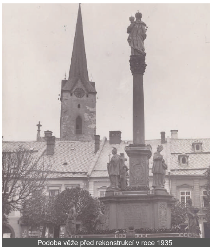
Podoba věže před rekonstrukcí v roce 1935