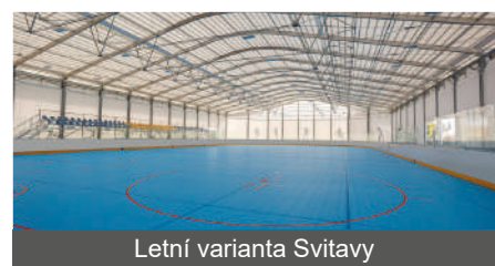
Letní varianta Svitavy

Tady bych chtěl zdůraznit, že město Mohelnice v posledních letech významně navýšilo podporu sportu a v průběhu několika let byly zrealizovány investice do rekonstrukcí sportovišť nebo se podařilo realizovat vybudování nových, a to i včetně cyklostezek. V případě multifunkční hokejové haly je město připraveno tento projekt uskutečnit na pozemku města mezi fotbalovým areálem a bazénem, kde je již roky nevyužitá travnatá plocha a je zde potřebná infrastruktura. Bylo by to logické doplnění našeho sportovního areálu. Příklady z jiných měst to jen potvrzují. Ze sportovních aktivit znám podobné areály ve Svitavách, Lanškrouně, Litomyšli nebo Moravské Třebové a musím říci, že tady také hledáme inspiraci.