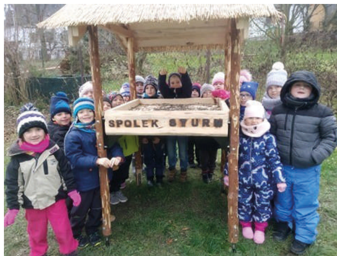
Kolektiv MŠ Na Zámečku.

Všechny další informace jsou k dispozici v šatnách jednotlivých tříd. Soutěž bude trvat do konce ledna a pěkné výtvary čeká ocenění. Porotou budou členové spolku STURM. Pokud bude zájem o dětská výtvarná díla z této soutěže, naším přáním by bylo, aby zdobila interiér domova důchodců.