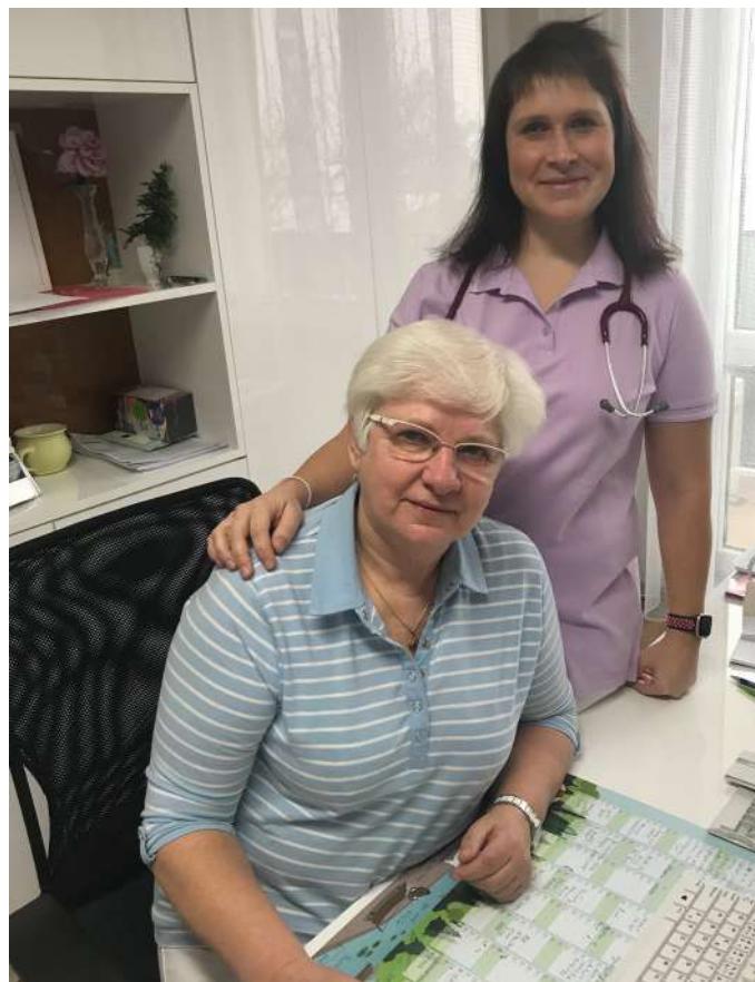
Matka a dcera, dvě doktorky, jedna nastupující a druhá odcházející.