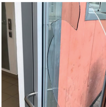
Čekárna na autobusovém nádraží: Když nemohu otevřít dveře, rozbiju je...