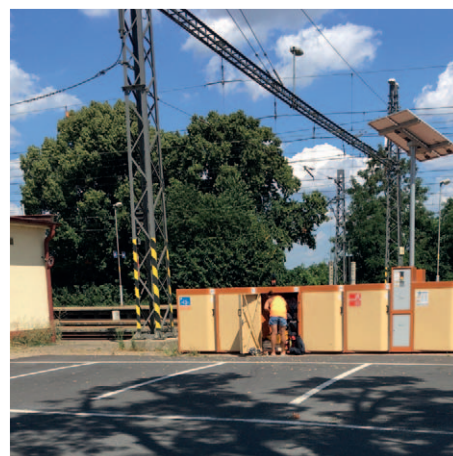
Cykloboxy vlakové nádraží: Úschovna věcí zdarma...