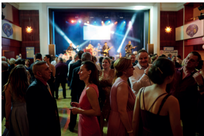
K tanci zahrála skupina WELZL G@NG.