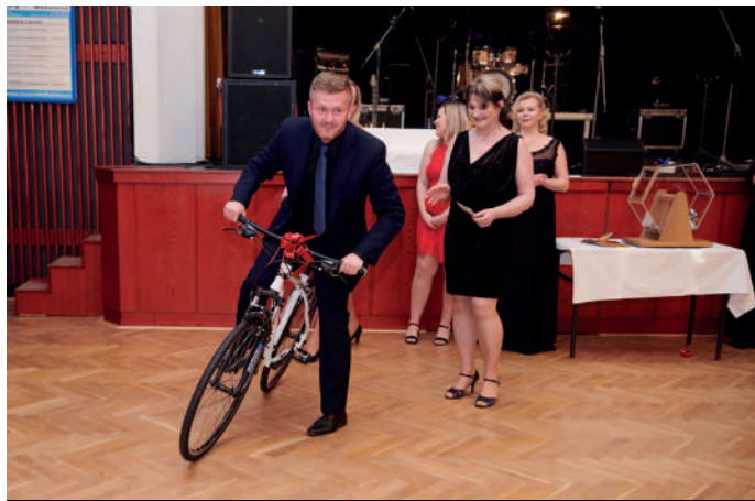
Jedna z hlavních cen tomboly byla hned na místě vyzkoušena.