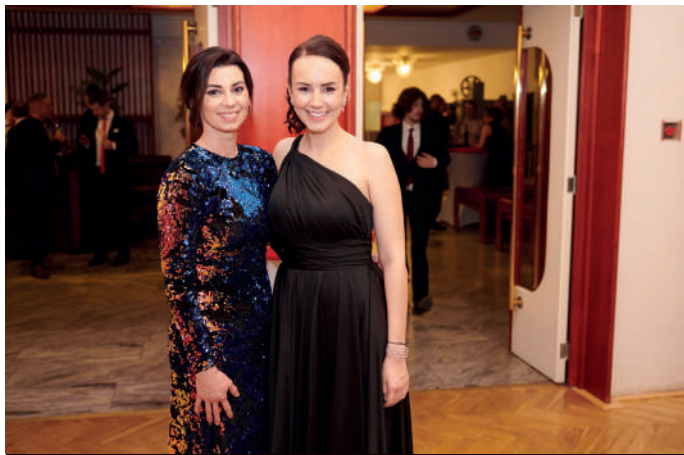
Dámy zdobí nejenom úsměv, ale i krásné šaty.