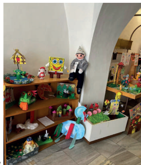
Kolektiv Mateřské školy Na Zámečku

ním provozu. Bezpečnost dětí je pro nás velmi důležitá. Děti si připomenuly zásady správného přecházení silnice, jízdy na kole, možnosti, kde si mohou bezpečně hrát.... Nahlédnout do tříd mateřské školy mohli zájemci v rámci dne otevřených dveří, který se konal 13. 4. 2023. I přes nepřízeň počasí byla MŠ plná dětí a jejich rodičů. Říká se: „Ve zdravém těle, zdravý duch!“ Naši malí předškoláci se konečně dočkali. Celý rok se těšili, až začnou chodit plavat. Výuka, která je organizována plaveckou školou, probíhá 1x týdně od května do červ-na. Hravou formou, pod odborným vedením plavčíc, se děti učí základům plavání. Na blížící se léto – čas koupání a dovolených – budou již připraveny. Velkou odměnou jsou pro nás spokojené a veselé děti.