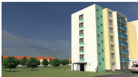
Stav po dokončení nové přístavby schodiště s výtahem

Radnice finišuje s ukončením přípravy projektu nového bočního vstupu, který umožní rozšíření lékařských ordinací na adrese Nádražní 35 v Mohelnici. Boční vstup do budovy lékařského domu nabídne nové komfortní schodiště s výtahem, které bude v případě nutnosti také sloužit jako evakuační.