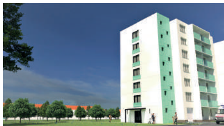
Budoucí stav po dokončení nové fasády celého domu, která je plánována v budoucích letech v rámci investic SVJ.