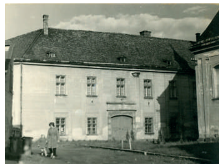
Mohelnické muzeum v 60. letech 20. století ze sbírky muzea.

přelomu 50. a 60. let a stálým expozicím, které vznikly v rámci obou sídel muzea, dále též krátkodobým výstavám, zahájeným v roce 1956, z nichž prim hrály po dlouhou dobu výstavy výtvarné. Připomenuto bude i začlenění mohelnického muzea (jako pobočky) do tehdejšího Vlastivědného ústavu v Šumperku (dnes Vlastivědné muzeum v Šumperku), k němuž došlo v roce 1967. Výstava neopomene ani vzpomínku na nejvýznamnější výzkumy a osobnosti mohelnické archeologie. Závěrečná část výstavy představí muzeum od roku 1989 do současnosti. Na výstavě bude možné zhlédnout např. první přírůstkovou knihu muzea z let 1921–1945, první návštěvní knihu z let 1923–1927, návštěvní knihy od roku 1951 do počátku 80. let, publikace (včetně katalogů z výstav), plakáty, pozvánky ad. Výstava bude obohacena o archivní dokumenty ze Státního okresního archivu Šumperk, vážící se k německému muzejnímu spolku a po-