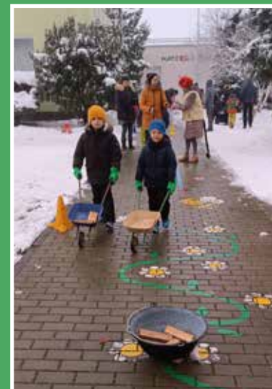
Děti a celý kolektiv MŠ Na Zámečku

Jedno velké přání do roku 2024 posíláme i vám čtenářům – redakci zpravodaje. Ať je zdraví tím nejdůležitějším pokladem na světě.