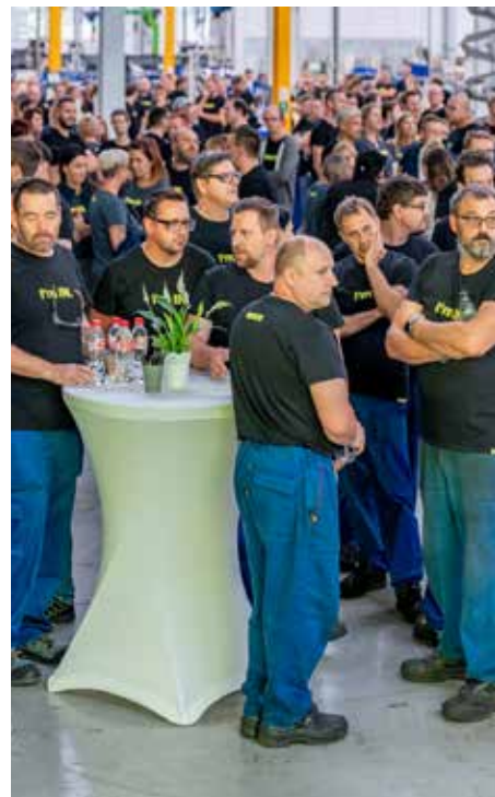
Změnu na Innomotics společnost oslavila se všemi zaměstnanci začátkem října přímo v prostorách výroby.

Ano, i tento rok chceme být partnerem důležitých kulturních akcí regionu a mezi ty hudební festival Fingers UP bezpochyby patří!