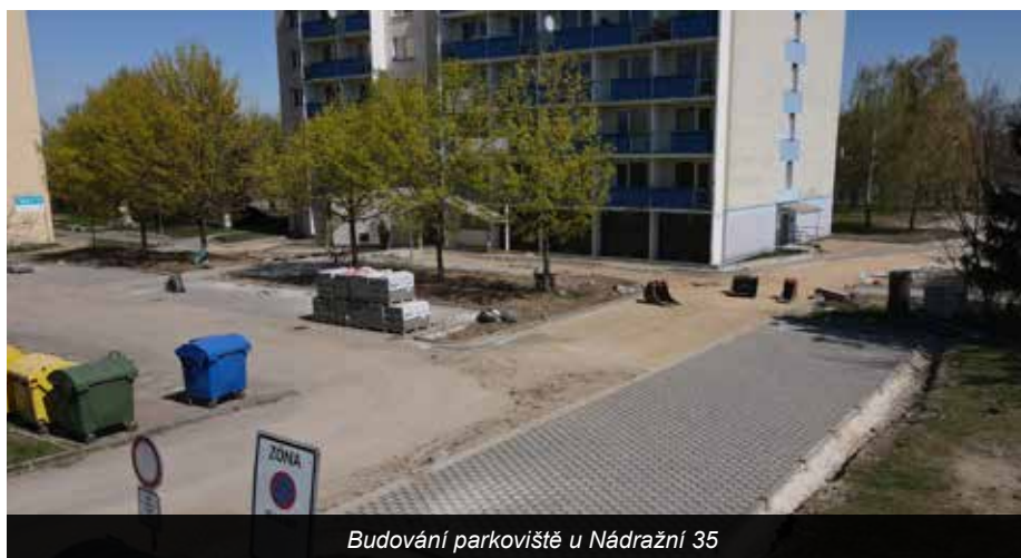
Budování parkoviště u Nádražní 35

Ano, řekl bych, že jsme v tomto směru v rámci mohelnických SVJ průkopníci. Kolem realizace FVE a obecně úspor energií se