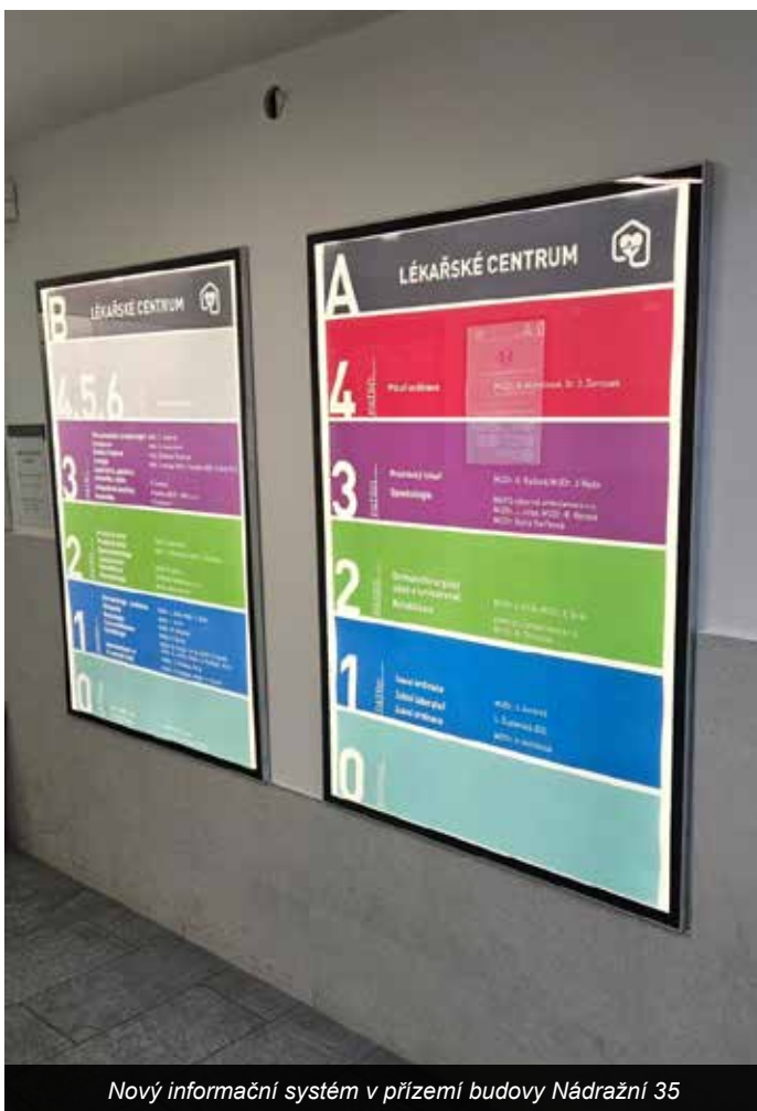
Nový informační systém v přízemí budovy Nádražní 35