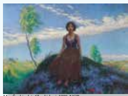
Max Švabinský, Chudý kraj, 1900, NGP

Představíme si život a dílo Maxe Švabinského skrze vzpomínky jeho ženy a dcery. Zaměříme se na interpretaci jeho zásadních obrazů jako Splynutí duší , Chudý kraj nebo Žlutý slunečník . Podíváme se na jeho brilantní kresby a grafiky v oblasti podobizen a krajin. A vysvětlíme si jeho přitažlivost pro dobu první republiky i pro temnou dobu po roce 1948.