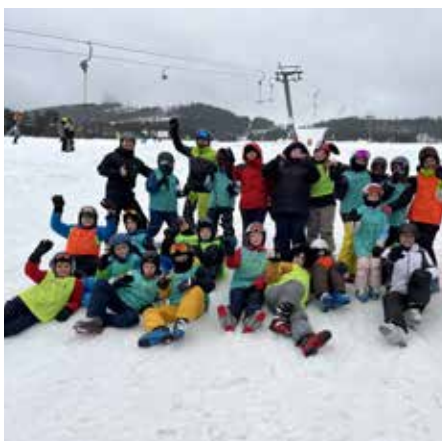
učitelé TV ZŠ Mlýnská

Na přelomu ledna a února se žáci 5. tříd ZŠ Mlýnská účastnili dvou turnusů lyžařského kurzu na školní chatě v Moravském Karlově. Výcvik probíhal ve SKI areálu na Dolní Moravě, kam žáky každý den vozil autobus. Podmínky byly skvělé, sněhu leželo na sjezdovkách dostatek. Celkem se kurzů zúčastnilo 42 lyžařů, kteří byli podle dovedností rozděleni do družstev. Lyžování na sjezdovkách přineslo spousty radosti i nezapomenutelných okamžiků. Bylo vidět nadšení našich lyžařů, ale i jejich neuvěřitelný pokrok od prvních nesmělých oblouků až po sebejisté sjezdy. Kromě sportu si všichni užili i chvíle odpočinku. Večerní program se nesl ve znamení společenských her, zábavy a smíchu. Žáci se poznali v jiném než školním prostředí, což vždy obohatí jejich vzájemné vztahy.